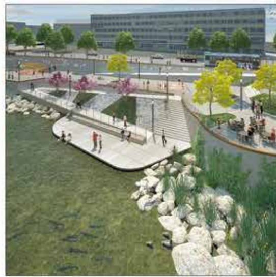
Bliesterrassen: Im zweiten Bauabschnitt wird das Südufer umgestaltet