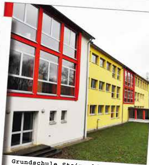
Grundschule Steinwald: Neue Klassenräume werden angebaut