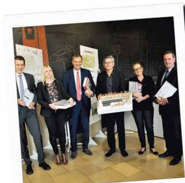
Kita Freiherr-vom-Stein: Mehr Platz für Betreuung durch Umsetzung des prämierten Entwurfs