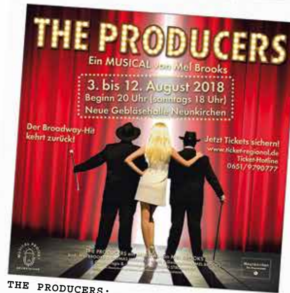
THE PRODUCERS: Der Broadway-Hit kehrt zurück