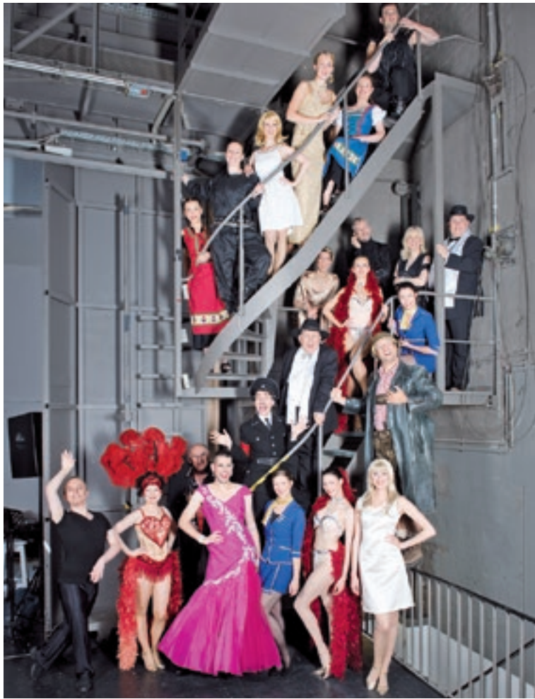
Ein Teil des Projekt-Ensembles