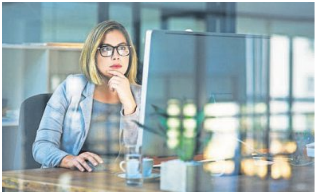
Im Saarland stehen aktuell 1191 Dienstleistungen über das Onlineserviceportal zur Verfügung. Weitere sollen im Laufe des Jahres folgen.

Bis Mitte dieses Jahres sollen weitere Online-Dienste eingeführt werden. Geplant sind unter anderem die elektronische Wohnsitzanmeldung sowie zusätzliche gewerbliche Online-Dienste für Tä-