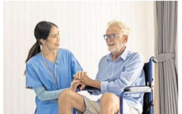
Aufgrund der demografischen Entwicklung immer mehr gefragt sind Berufe in der Pflege.

Auch im kaufmännischen und dienstleistungsorientierten Bereich besteht eine anhaltend hohe Nachfrage nach Auszubil-