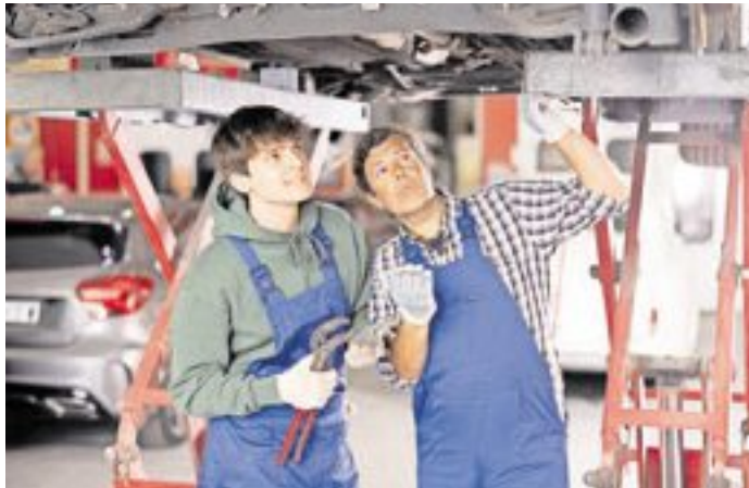
Handwerk hat insbesondere im Mechatroniker-Bereich noch immer goldenen Boden.

Einen weiteren bedeutenden Bereich stellen IT-Ausbildungsberufe dar. Insbesondere der Beruf