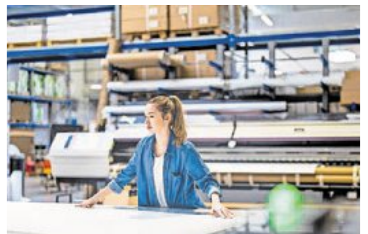
Druckberufe im Printbereich gelten als wenig zukunftssicher.

Darüber hinaus betrifft die Unsicherheit Berufe mit geringem Spezialisierungsgrad im Handwerk, etwa ungelernete Hilfskräfte