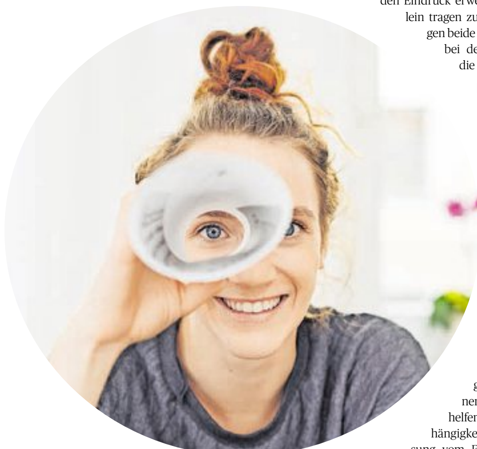
Viele Jugendliche sind auf der Suche nach dem richtigen Beruf bzw. Ausbildungsplatz.

Wenn es einmal nicht weitergeht, kann eine Pause mit festem Wiederaufnahme-Termin Wunder wirken. Wer früh genug anfängt, kann entspannter an die Sache herangehen.