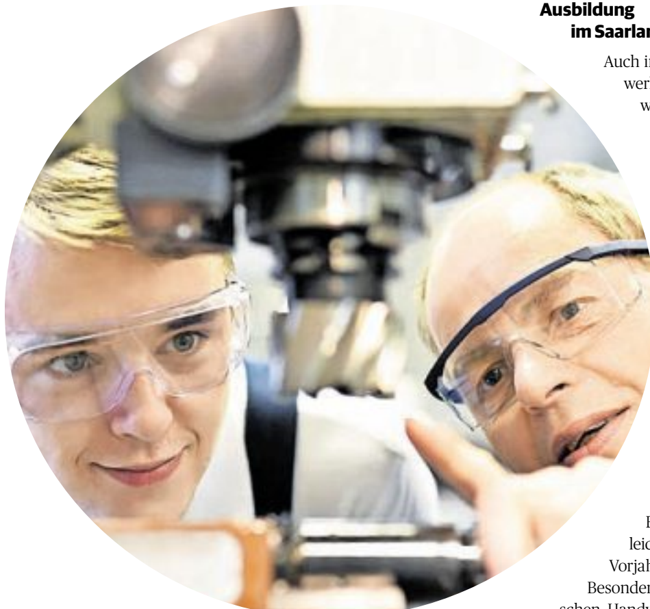
Immer mehr junge Menschen entscheiden sich für eine Ausbildung im Handwerk.

Nach dem erfolgreichen Abschluss der Ausbildung stehen im Handwerk verschiedene Weiterbildungs- und Karrierewege offen. Dazu gehören unter anderem Qualifikationen wie der Meisterabschluss, fachliche Spezialisierungen oder kaufmännische Weiterbildungen, etwa im Bereich Betriebsführung. Die Handwerkskammern bieten hierzu Beratungs- und entsprechende Fortbildungsangebote an. Das Handwerk spielt zudem eine wichtige Rolle für Wirtschaft und Gesellschaft. Es trägt zur Versorgung der Bevölkerung bei und ist in Bereichen wie Bauen, Energie, Mobilität und Dienstleistungen unverzichtbar. Für junge Menschen, die praktisch arbeiten möchten, Verantwortung übernehmen wollen und Wert auf einen klar strukturierten Berufseinstieg legen, kann eine Ausbildung im Handwerk daher eine attraktive und zukunftsorientierte Wahl sein, die der erste Schritt einer längeren Karriere sein kann.