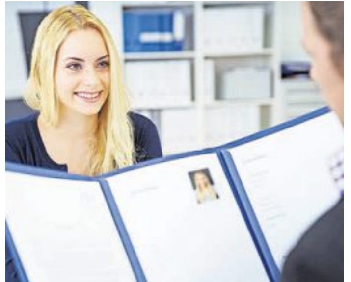
Eine professionelle Bewerbung ist der Schlüssel zum Vorstellungsgespräch – sie überzeugt durch Struktur, klare Inhalte und ein stimmiges Gesamtbild.

Nicht in eine Bewerbung gehören unpassende persönliche Informationen wie Religion, Familienstand, politische Ansichten oder Sexualität. Auch negative Formu-