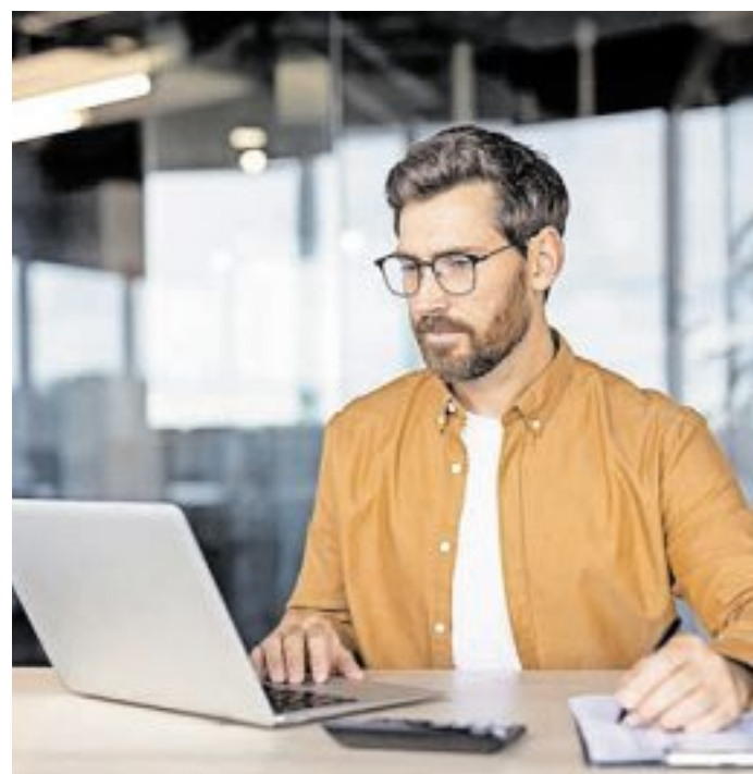
Soziale Kompetenzen wie Anpassungsfähigkeit und digitales Know-how werden in der modernen Arbeitswelt immer wichtiger für den beruflichen Erfolg.

Die Trennlinien zwischen beruflicher und privater Sphäre verschwimmen zunehmend. Anni Hering zufolge können Arbeitnehmer von dieser Entwicklung