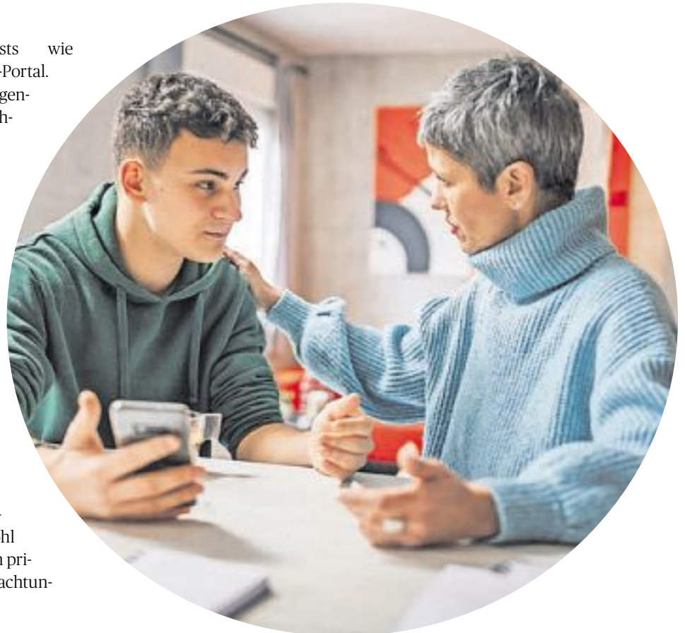
Viele Jugendliche können bei der Berufswahl Unterstützung der Eltern gut gebrauchen.

Orientierungsexperten unterstreichen die Bedeutung des aktiven Zuhörens. Offene Fragen stellen, zum eigenständigen Denken anregen und Gelassenheit bewahren - das sind Schlüsselkomponenten. Auch Umwege und Neuorientierungen sind wertvolle Erfahrungen und keineswegs das Ende des Weges. Bei völliger Antriebslosigkeit können konkrete Perspektiven helfen: Mehr finanzielle Unabhängigkeit, eigene Freiheiten, Loslösung vom Elternhaus. Auch der Austausch mit Gleichaltrigen kann neue Impulse geben.