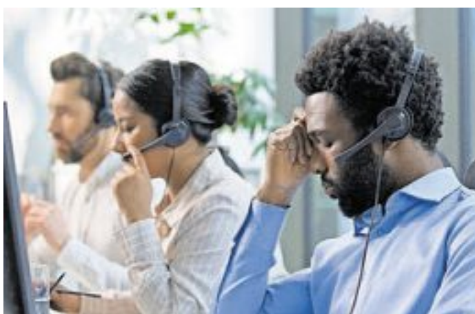
Klassische Telefon- und Callcenter-Berufe sind durch den Einsatz von automatisierten Systemen langfristig gefährdet.

Auch Druck- und Medienberufe gelten als weniger zukunftssicher. Dazu gehören beispielsweise Drucker oder Mediengestalter