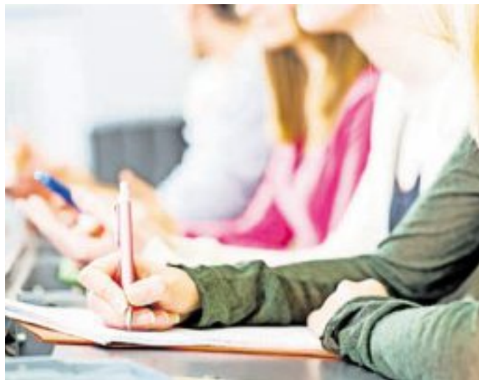
Weiterbildung ist die Grundlage, um bei der rasanten wirtschaftlichen und gesellschaftlichen Entwicklung den Anschluss zu halten.

Die Betriebszugehörigkeit muss zum Zeitpunkt der Maßnahme mindestens sechs Monate betragen und die Arbeitsstätte muss im Saarland liegen. Die Freistellung bezieht sich meist auf politische und berufliche Weiterbildung, aber auch auf Teile der allgemeinen Weiterbildung, insbesondere auf die Qualifizierung für ein Ehrenamt.